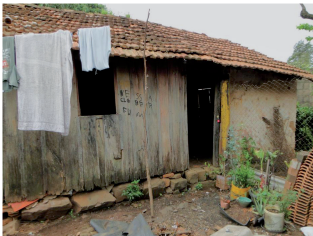
Figura 2. Barraco da Gegê. Vila Isabel. São Carlos, 2013.

Assim como os demais moradores do bairro, Geralda não possuía muitas relações com os vizinhos. Para além das dificuldades já detectadas nas relações de vizinhança, Geralda não dispunha de tempo livre, pois saía bem cedo e voltava só a noite do trabalho , depois que chegava era a hora de cuidar dos afazeres da casa, fazia pão no forno a lenha, lavava as roupas de escola das crianças . Com tanto trabalho, não sobrava tempo para conversas e para nenhum tipo de lazer, segundo ela, nunca tive regalia de passear . Seu cotidiano se restringia ao trabalho, aos cuidados dos filhos e de sua mãe. Dona Benedita veio morar no Barraco da Gegê 18 em 1975, quando seu marido faleceu, deixando a casa principal para os filhos mais velhos. Dona Benedita retribuiu o apoio que sempre recebeu de Geralda, cuidando dos netos, enquanto ela cumpria sua árdua jornada de trabalho.