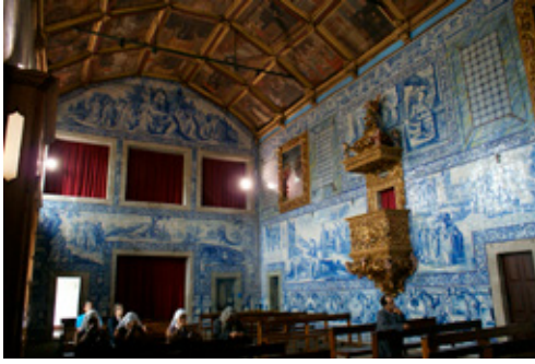
Fig. 5. Iglesia del convento de Nossa Senhora do Terço (Barcelos, Portugal). Vista del interior hacia los pies del templo