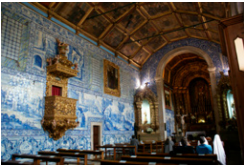
Fig. 4. Iglesia del convento de Nossa Senhora do Terço (Barcelos, Portugal). Vista del interior hacia la cabecera del templo

pequeñas ventanas, y algunas puertas en apariencia posteriores.