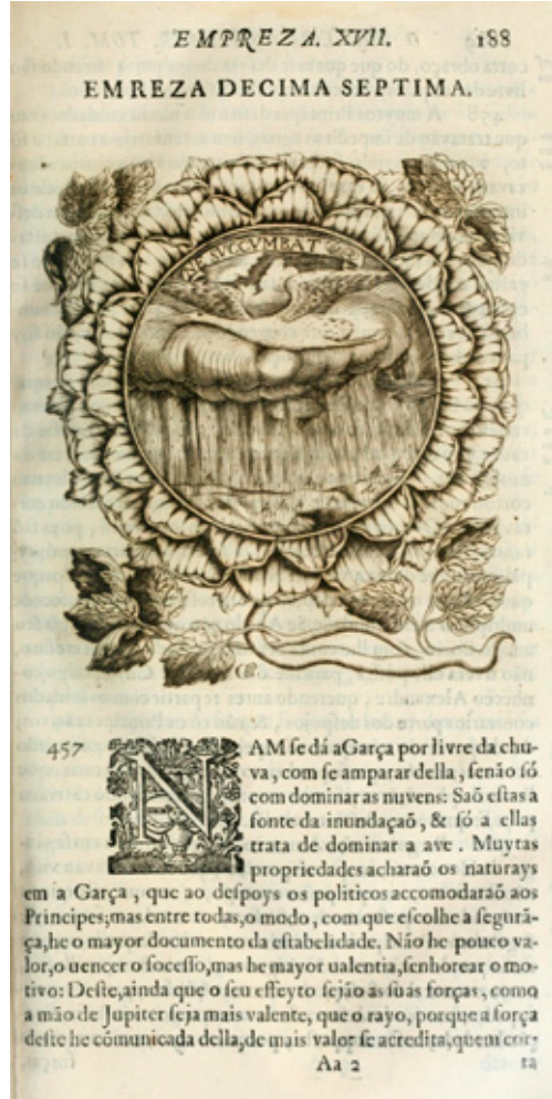
Fig. 8. Frei João dos Prazeres, O Príncipe dos Patriarcas S. Bento. Primeiro tomo de sua Vida (Lisboa, 1683). Empresa XVII (una garça que vuela sobre las nubes que descargan lluvia): NE SVCCVMBAT

una estructura sustentada en los más notables episodios de la biografía del patriarca, que conocemos básicamente gracias al segundo libro de los Diálogos de san Gregorio Magno. De este modo, cada capítulo está presidido por un título que refiere de manera sintética alguna cualidad o acción de san Benito –con lo que se anticipa el asunto aludido en cada empresa–, bajo el cual se dispone la pictura o imagen grabada, con el lema latino inserto en el campo de representación de la misma; a continuación se desarrolla una extensa glosa o comentario con la función de desvelar el sentido oscuro de la composición a la luz de las numerosas autoridades referidas (fig. 8) 21 . Este comentario o declaración, en el que se conjugan todos los recursos disponibles –paranéticos, contenidos hagiográficos y estructuras emblemáticas– con el propósito de amplificar el efecto retórico del texto, integra los más diversos tipos de argumentos, que engloban un imponente despliegue de referencias eruditas –bíblicas,