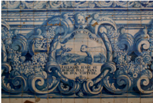
Fig. 10. Iglesia del convento de Nossa Senhora do Terço (Barcelona, Portugal). Jeroglífico 5 del zócalo (un grupo de animales se sitúa frente a una pantera que exhala su aliento): IN ODOREM CVRRIMVS

manera simultánea como enseñanzas generales y como atributos específicos de un individuo.