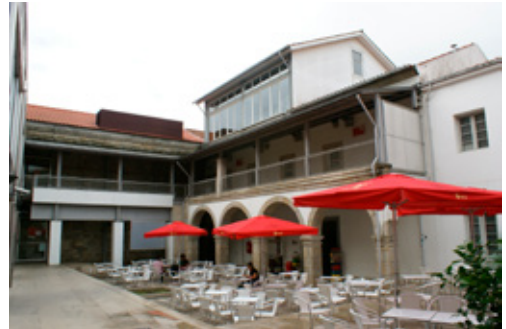
Fig. 2. Convento de Nossa Senhora do Terço (Barcelos, Portugal). Restos del claustro, transformado en patio-terracea del Centro Comercial do Terço

mente todo su mobiliario y el rico dispositivo ornamental original, configurando una de las más esplendorosas expresiones del barroco nacional portugués, en lo que, gracias a la densa mezcla de géneros y recursos artísticos, se ha convenido en denominar la “obra de arte total”.