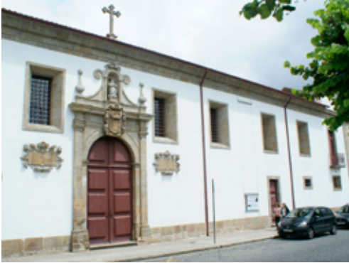
Fig. 3. Iglesia del convento de Nossa Senhora do Terço (Barcelos, Portugal). Fachada lateral exterior