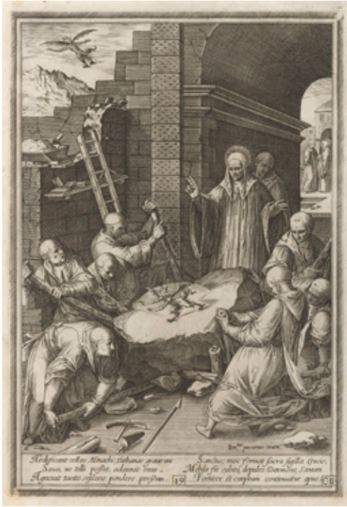
Fig. 14. Bernardino Passeri y Aliprando Caprioli, Vita et miracula sanctissimi patris Benedicti , ex libro II Dialogorum beati Gregorii papae, et monachi (Roma, 1579)