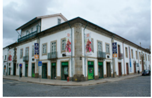
Fig. 1. Convento de Nossa Senhora do Terço (Barcelos, Portugal). Aspecto del exterior de sus dependencias en la actualidad

A pesar de la lamentable peripecia histórica sufrida por el convento 5 , la iglesia ha logrado subsistir hasta nuestros días en un excelente estado de preservación: ha sabido conservar práctica-