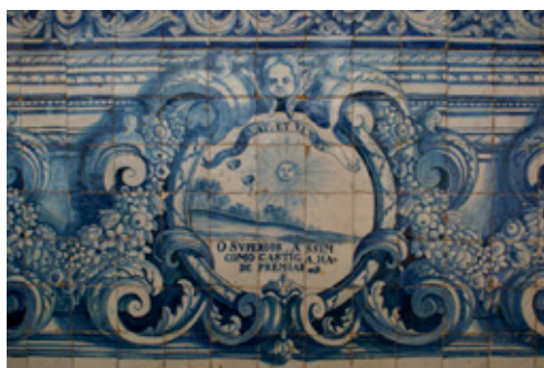
Fig. 13. Iglesia del convento de Nossa Senhora do Terço (Barcelos, Portugal). Jeroglífico 9 del zócalo (dos ojos suspendidos en el cielo contemplan el sol; uno de ellos llora): ALLEVAT, ET VEXAT

Sin embargo, y a pesar de estos rasgos, muy probablemente intencionados, que facilitan a priori la correcta percepción de las picturae em-