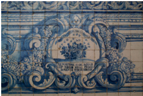
Fig. 12. Iglesia del convento de Nossa Senhora do Terço (Barcelos, Portugal). Jeroglífico 10 del zócalo (un enjambre de abejas vuela sobre un arbusto con flores): NON EX OMNI FLORE CARPITVR MEL

lectura a un lector poco avisado o imperito en historia clásica y mitología 40 ; por otro, también han perdido la justificación hagiográfica –recordemos que cada empresa se vinculaba a un episodio de la vida de san Benito que servía de punto de par-