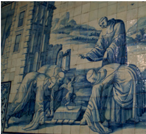
Fig. 15. Iglesia del convento de Nossa Senhora do Terço (Barcelos, Portugal). Detalle de la escena en la que san Benito, impartiendo su bendición, expulsa al demonio que impedía elevar un bloque de piedra para construir un monasterio

a las indicaciones proporcionadas gentilmente por el profesor José Manuel Alves Tedim, tales composiciones sobre la vida de san Benito y de los momentos culminantes de la historia fundacional de la Orden fueron inspiradas por las imágenes de sendas obras, profusamente ilustradas en ambos casos con grabados calcográficos de excelente calidad: hablamos de Vita et miracula sanctissimi patris Benedicti, ex libro II Dialogorum beati Gregorii papae, et monachi [...] (Roma, 1579), de Bernardino Passeri y Aliprando Caprioli, y del Speculum & exemplar chisticolarum. Vita beatissimi patris Benedicti, monachorum patriarchae sanctissimi (Roma, 1587), de Angelus Sangrinus y Bartolomeo Bonfadino. Aunque a primera vista no se aprecia una plena afinidad formal entre las estampas de estos tratados hagiográficos y los cuadros cerámicos de Barcelos, una mayor atención a los detalles permite detectar, al menos en algunas de las composiciones, un “parecido razonable” entre ambos imaginarios, que permitiría confirmar la naturaleza de sendos libros como fuente gráfica de ciertas representaciones del programa narrativo de la iglesia portuguesa (figs. 14 y 15).