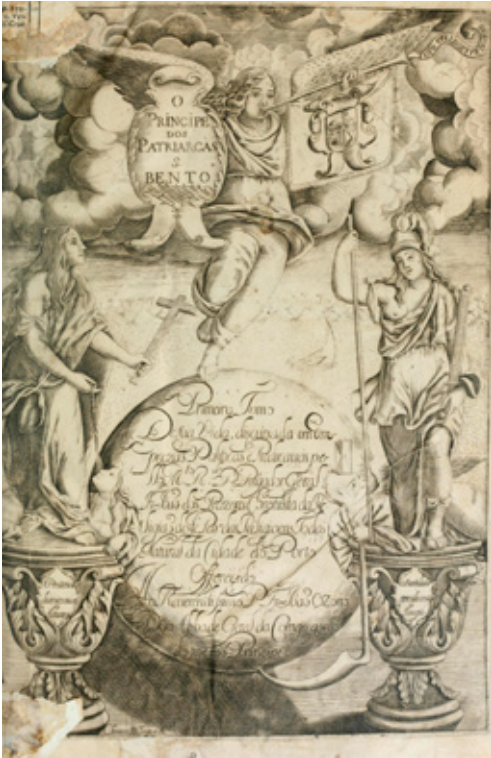
Fig. 7. Frei João dos Prazeres, O Príncipe dos Patriarcas S. Bento. Primeiro tomo de sua Vida (Lisboa, 1683). Frontispicio grabado

una estructura sustentada en los más notables episodios de la biografía del patriarca, que conocemos básicamente gracias al segundo libro de los Diálogos de san Gregorio Magno. De este modo, cada capítulo está presidido por un título que refiere de manera sintética alguna cualidad o acción de san Benito –con lo que se anticipa el asunto aludido en cada empresa–, bajo el cual se dispone la pictura o imagen grabada, con el lema latino inserto en el campo de representación de la misma; a continuación se desarrolla una extensa glosa o comentario con la función de desvelar el sentido oscuro de la composición a la luz de las numerosas autoridades referidas (fig. 8) 21 . Este comentario o declaración, en el que se conjugan todos los recursos disponibles –paranéticos, contenidos hagiográficos y estructuras emblemáticas– con el propósito de amplificar el efecto retórico del texto, integra los más diversos tipos de argumentos, que engloban un imponente despliegue de referencias eruditas –bíblicas,